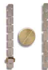
Eslabón de Repuesto