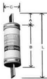
70 a 600 A