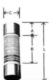
3 a 60 A 250 Volts O Menos